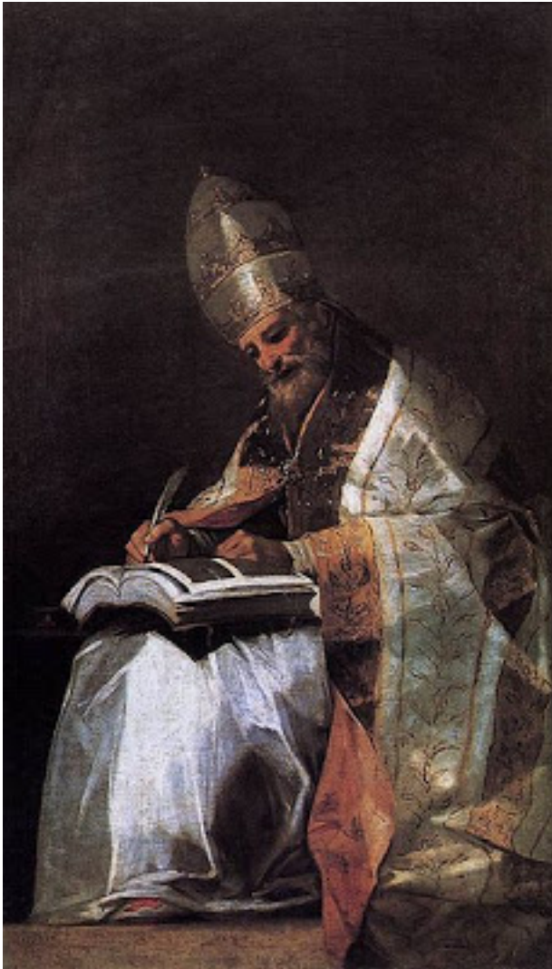
San Gregorio. (Goya)

Aparte del obligado paseo por las calles medievales de Canterbury, su Catedral es sin duda el mayor atractivo de esta ciudad, situada al sur de Inglaterra. Muchos adjetivos pueden darse a este magnífico monumento, principal templo de la iglesia anglicana. Su soberbia estampa gótica eclipsa a todas cuantas existen en un país que no es pobre en catedrales.